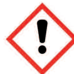
Produits altérant la santé