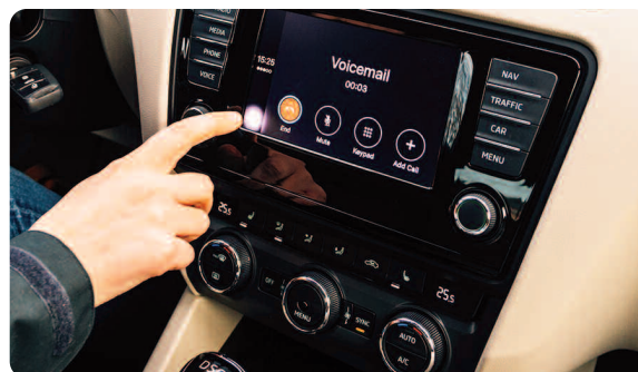
En voiture, utilitaire, poids lourd... : dispositif intégré au véhicule