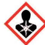
Produits nuisant gravement à la santé