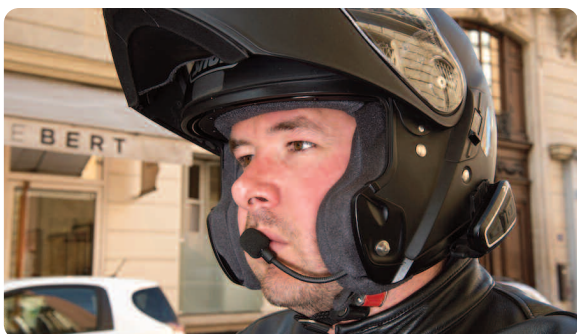
A deux-roues motorisé : dispositif intégré au casque