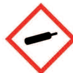
Gaz sous pression